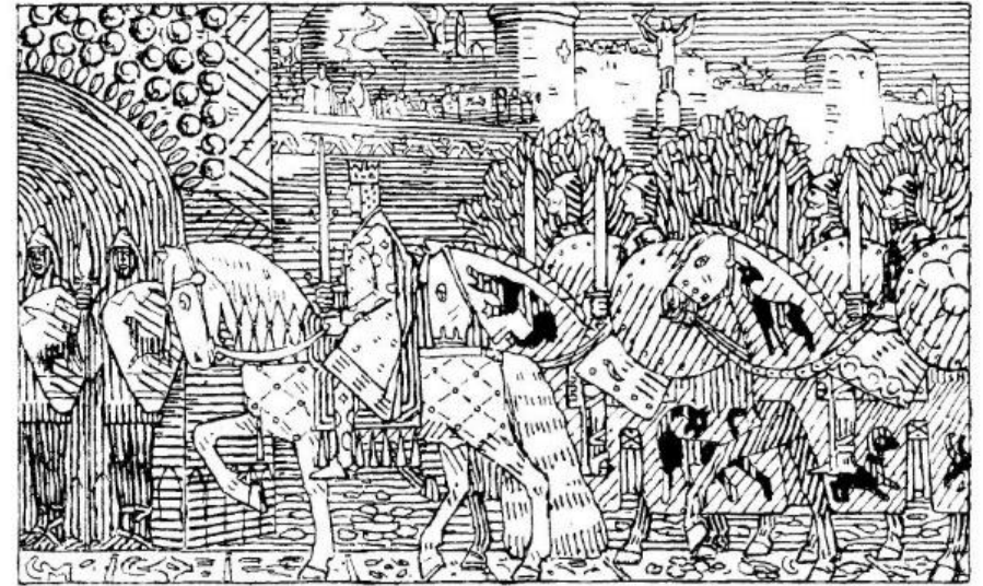
Illustrasjon: Gerhard Munthe/Heimskringla